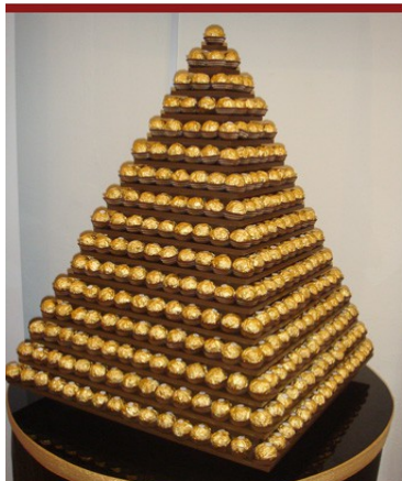
piramida ferrero rocher