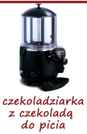
czekoladziarka z czekoladą do picia